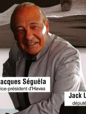
Jacques Séguéla vice-président d'Havas