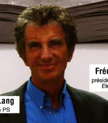
Jack Lang député PS